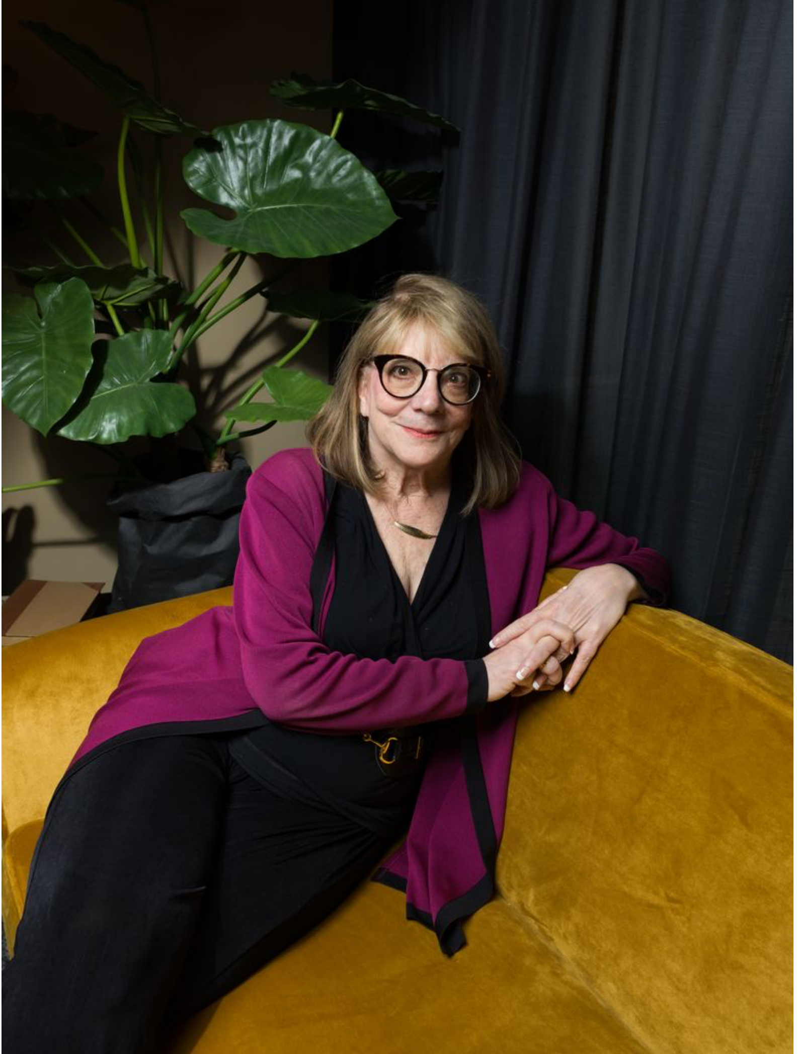
Elizabeth Loftus in Utrecht.

Een paar uur na het interview stuurt ze een e-mail. ‘Misschien leuk om het artikel mee te beginnen: misinformation is in de VS gekozen tot woord van het jaar.’ Dat had het Amerikaanse onlinewoordenboek Dictionary.com die dag bekendgemaakt. Het bewijst volgens de organisatie dat de strijd tegen nepnieuws leeft.