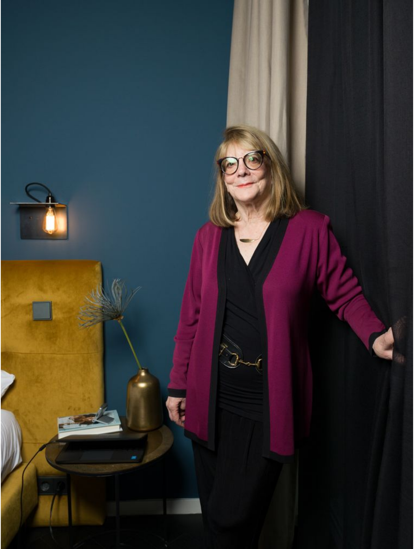
Elizabeth Loftus.

Tijdens deze zogeheten memory wars schreef Loftus het artikel The Reality of Repressed Memories (1993), dat insloeg als een bom. Bestaat het verschijnsel verdringing eigenlijk wel? Kunnen mensen herinneringen aan seksueel misbruik wegstoppen, om ze tientallen jaren later ineens weer te hervinden?